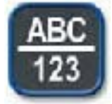
“虚拟键盘” —方便灵活地使用ABC键