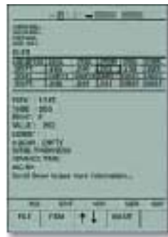
文件快速方便的导航功能