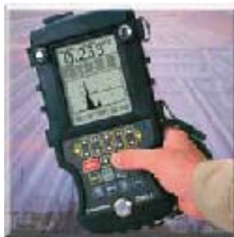
可插入测量读数的微型栅格功能