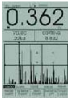
显示涂层和材料厚度的A扫描图