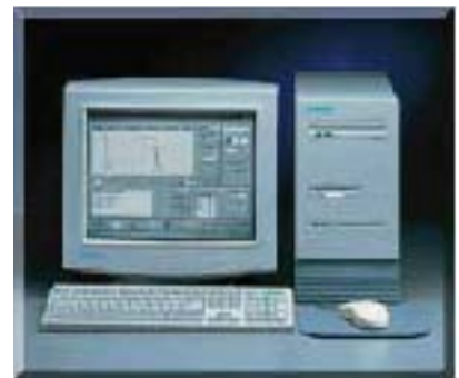
带有应用软件的DMS 2系列数据管理系统能对数据和文件进行传输及管理